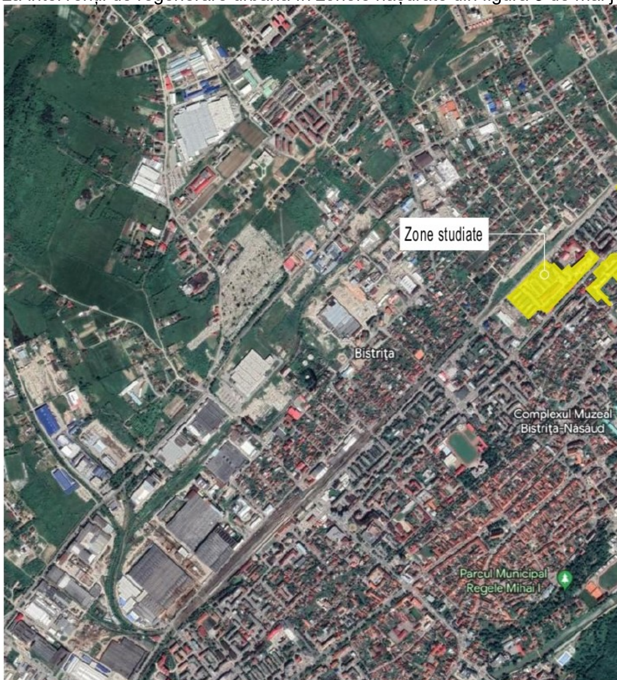
Figura 3. Zona de intervenție a proiectului Regenerarea urbană a spațiilor publice degradate - zona Andrei Mureșanu

Proiectul depus spre finanțare în cadrul Programului Regional Nord-Vest vizează intervenții de regenerare urbană în zonele hașurate din figura 3 de mai jos.