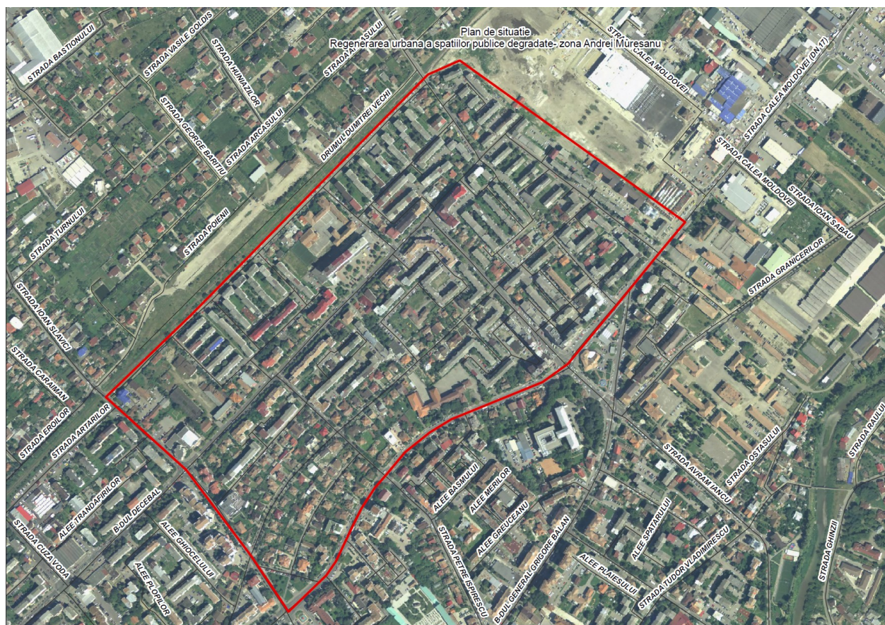
Figura 2. Zona de regenerare urbana Andrei Mureșanu