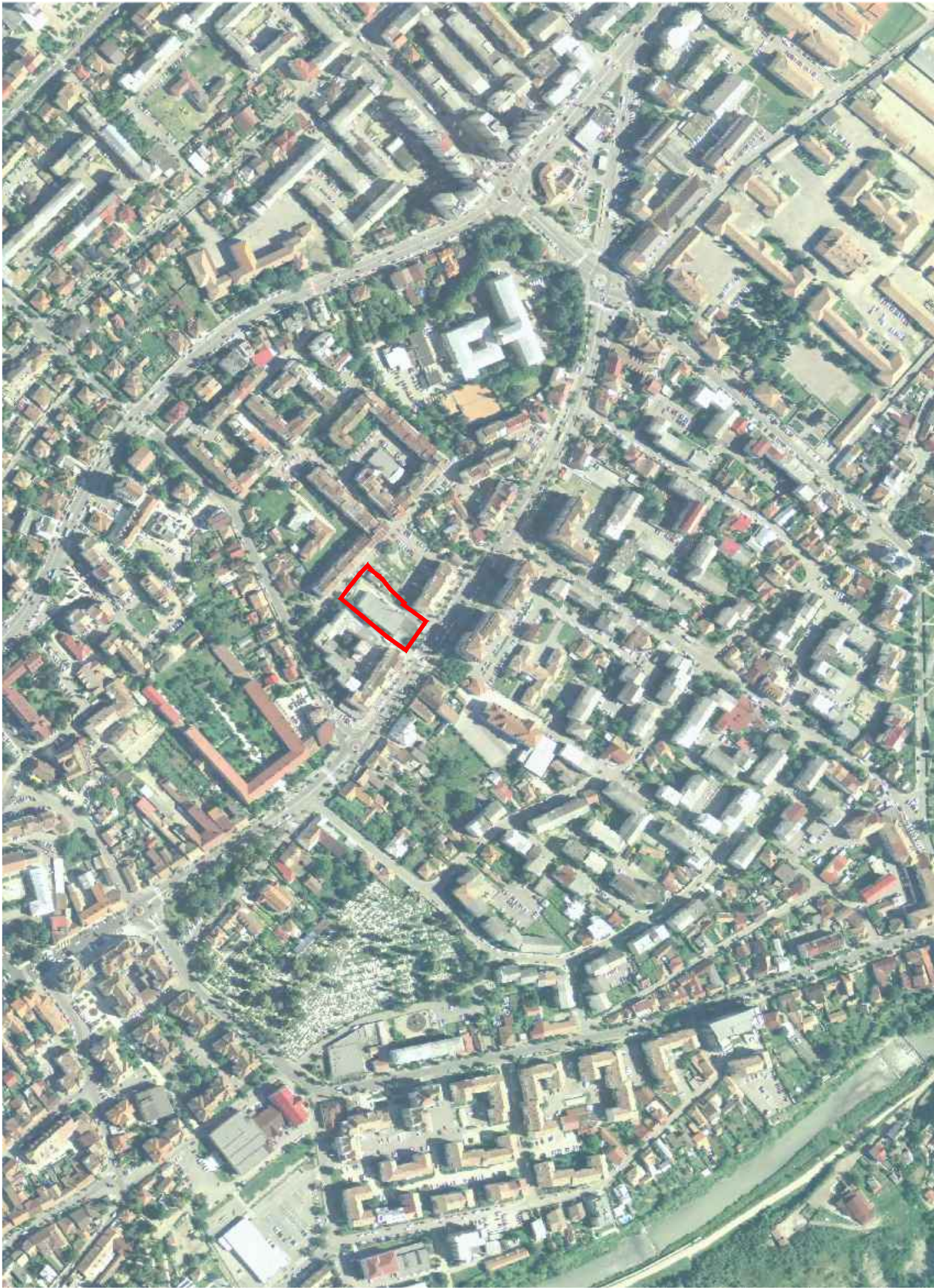
PLAN DE INCADRARE IN TERITORIU