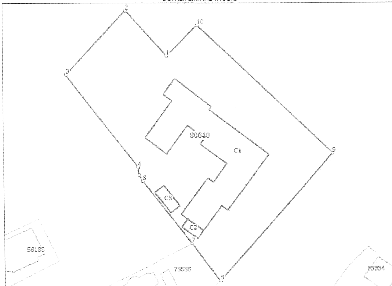
DETALII LINIARE IMOBIL

* Suprafața este determinată în planul de proiecție Stereo 70.