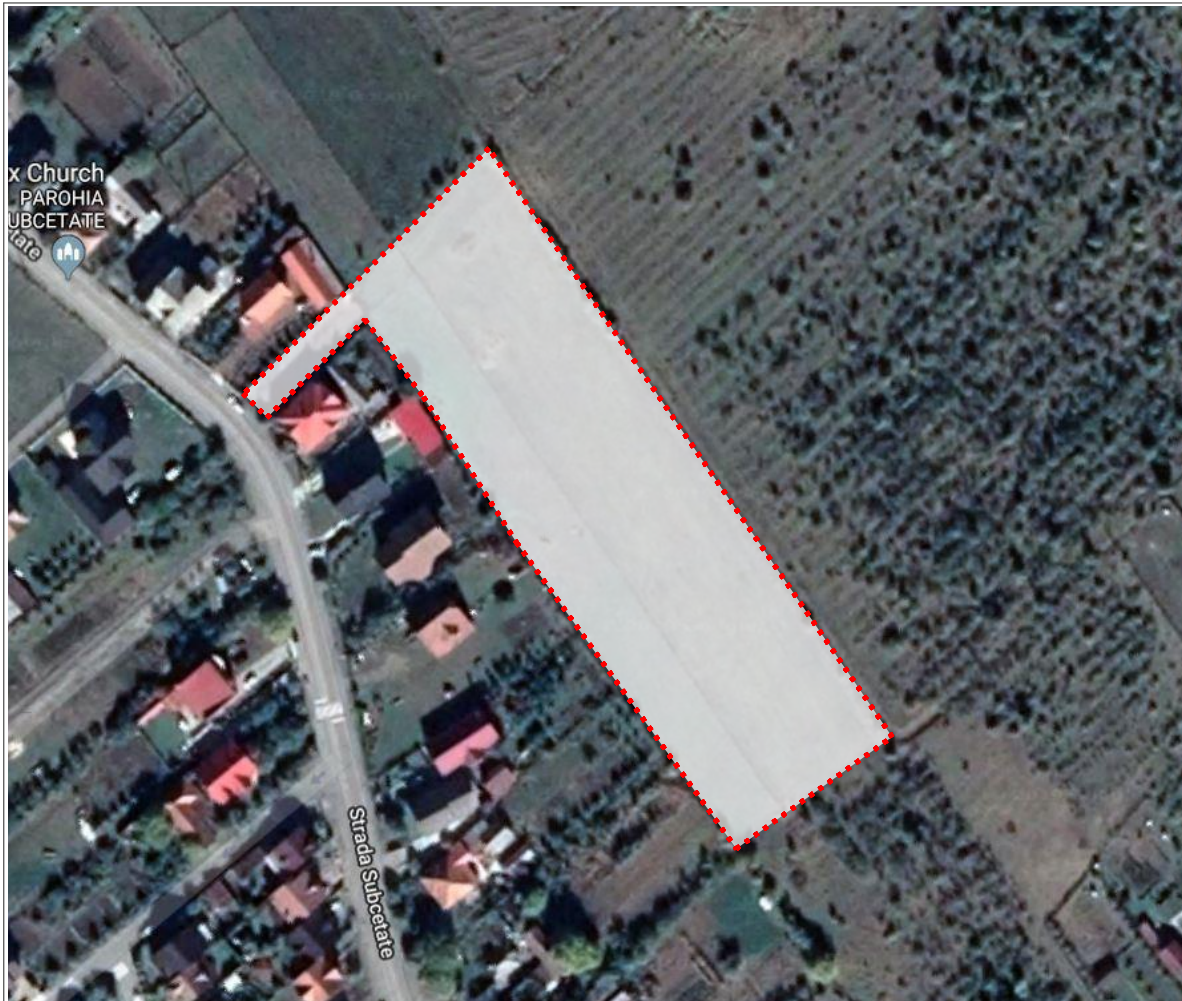
INCADRARE IN TERITORIU