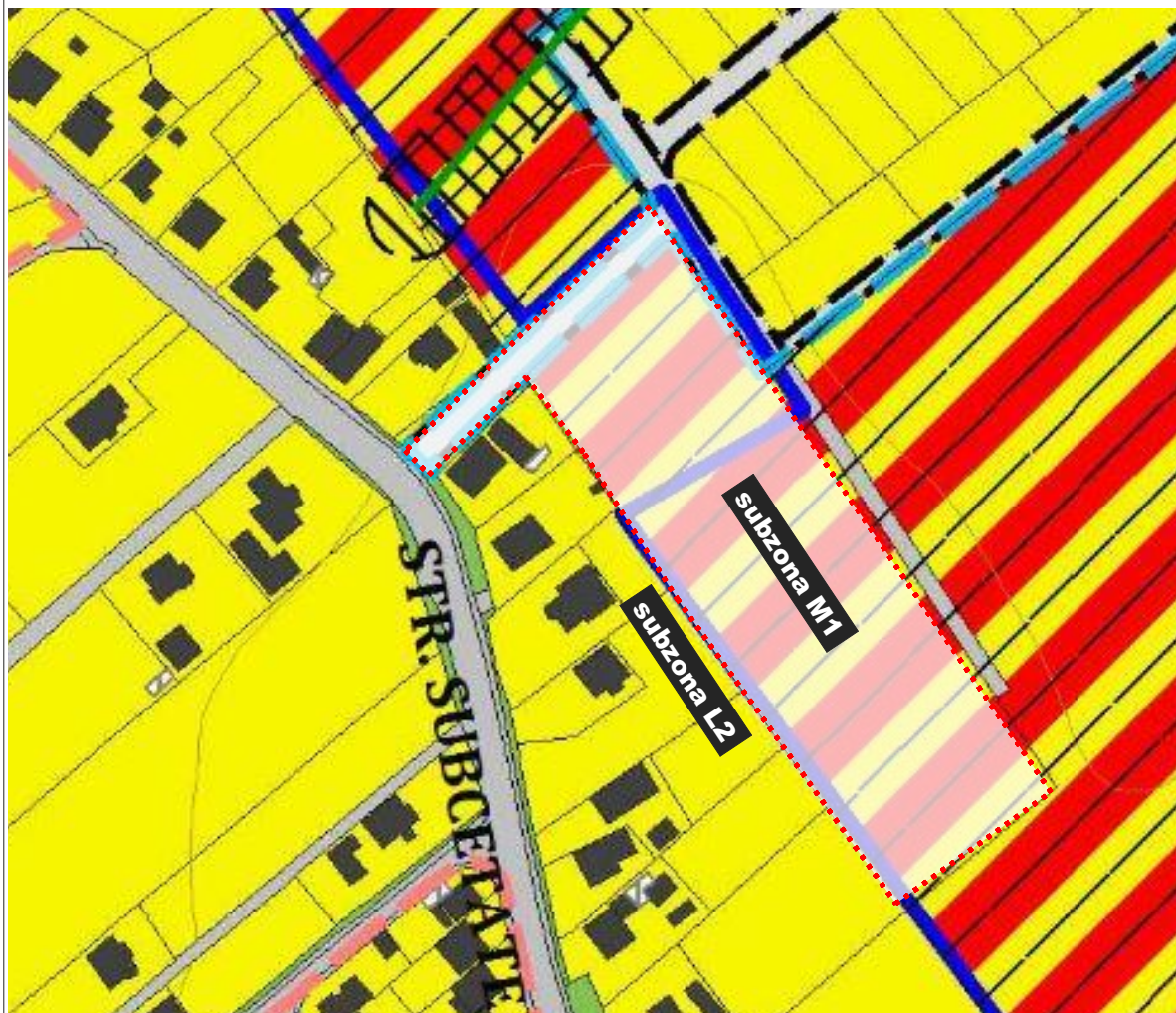
INCADRARE IN P.U.G. BISTRITA - UTR 25