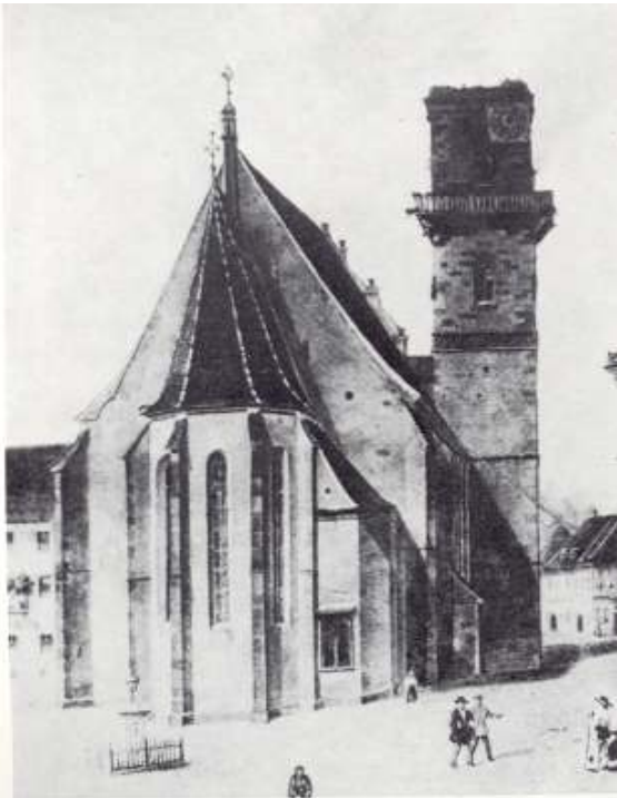
35 · Evang. Kirche von Bistritz mit 1857 abgebranntem Turm

Intre 1560-1563 a fost adăugată și sacristia de pe latura nordică, la care cele mai valoroase piese de piatrărie sunt portalul de acces din zona